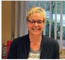
C. Greiwe Schul- und Internatsverwaltung