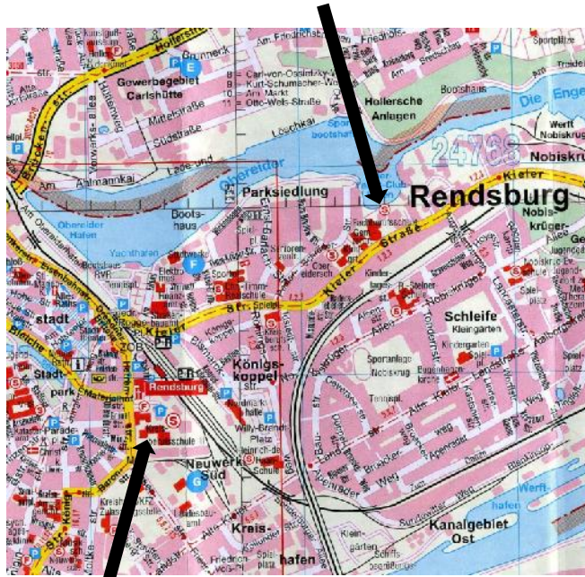
Berufsbildungszentrum am Nord-Ostsee-Kanal Herrenstr. 30-32, 24768 Rendsburg

Internat des Trägerverbandes der Landesberufsschulen Rendsburg Kieler Str. 35a, 24768 Rendsburg